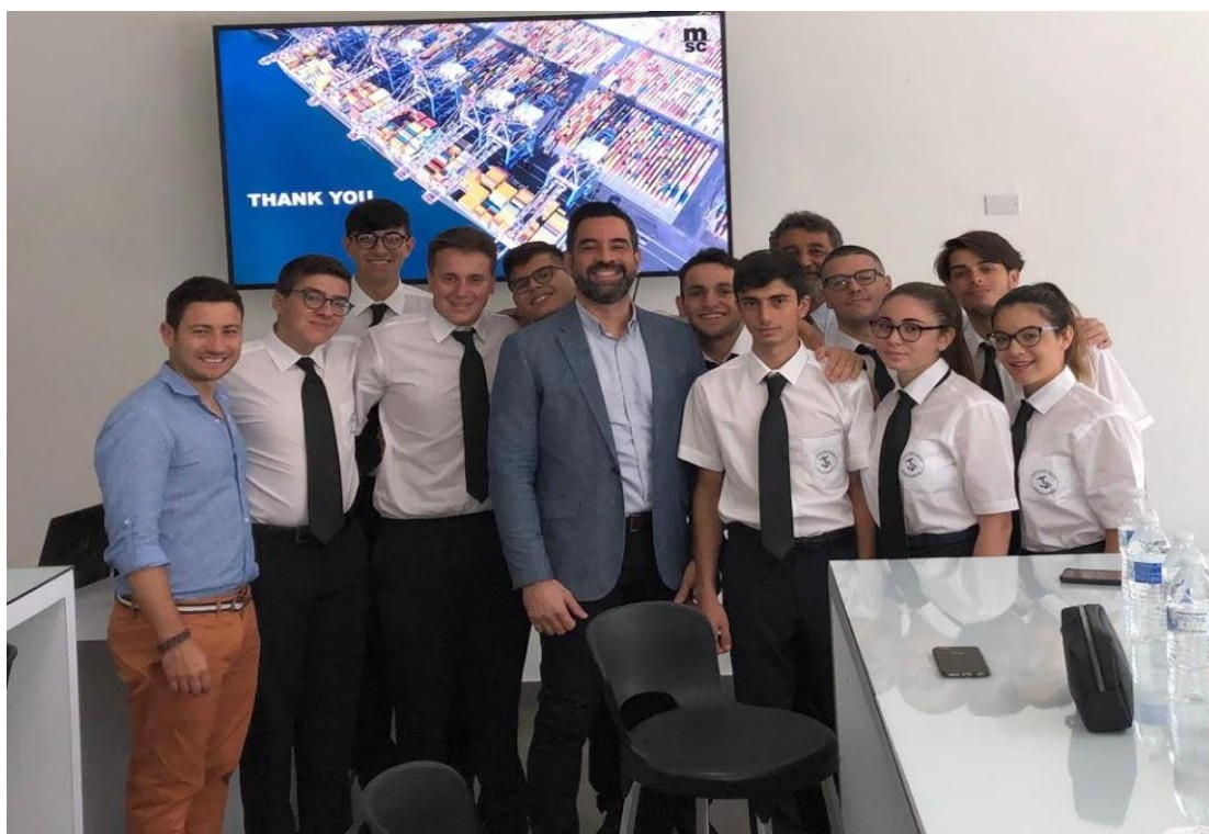
I nostri alunni con i Comandanti ed il Tutor

I nostri diplomati con il massimo dei voti sono, inoltre, destinatari di un'ulteriore borsa di studio che l'Istituto riserva loro per premiare la dedizione allo studio e la continuità dell'impegno nel quinquennio