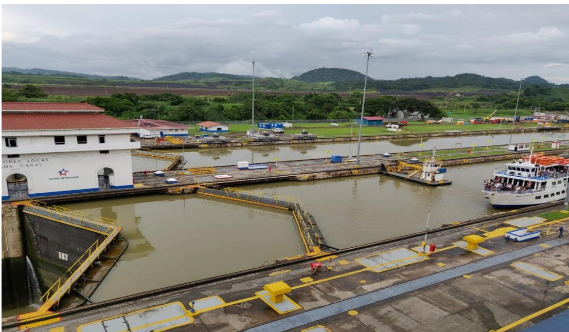
Canale di Panama