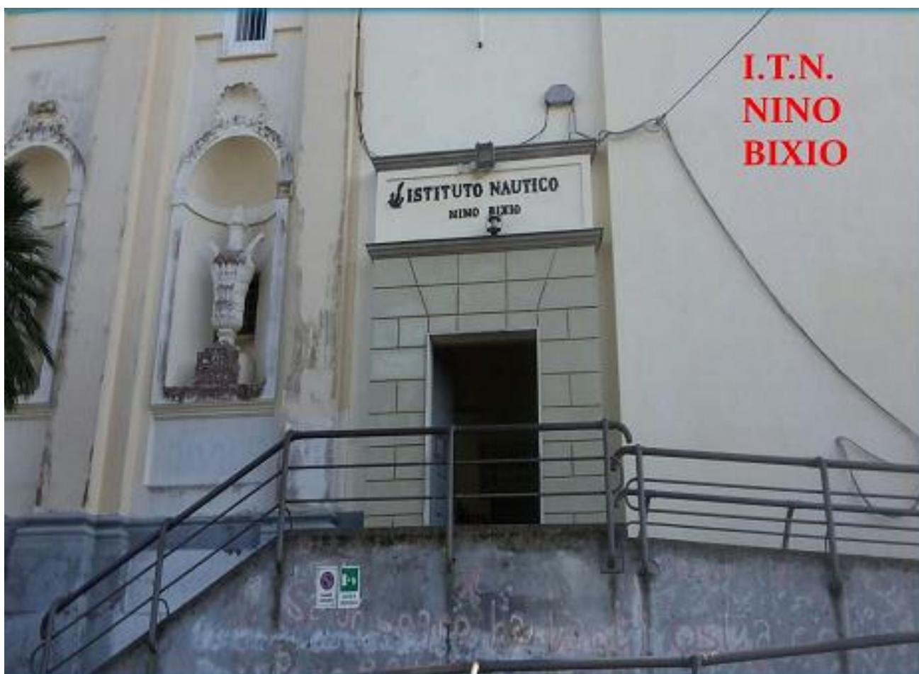
Ingresso Istituto Nautico " N. Bixio"

Dal 2013 la didattica si sviluppa secondo le STCW (Standards of Training, Certification and Watchkeeping) , in modo da essere adeguata ai nuovi standard internazionali. L'Istituto, infatti, dispone di un simulatore di macchine che si aggiunge al simulatore integrato di navigazione e manovra.