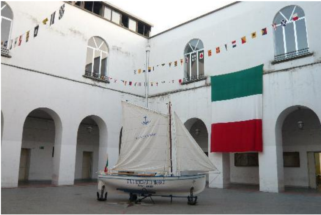
Chiostro dell'Istituto Nautico N. Bixio