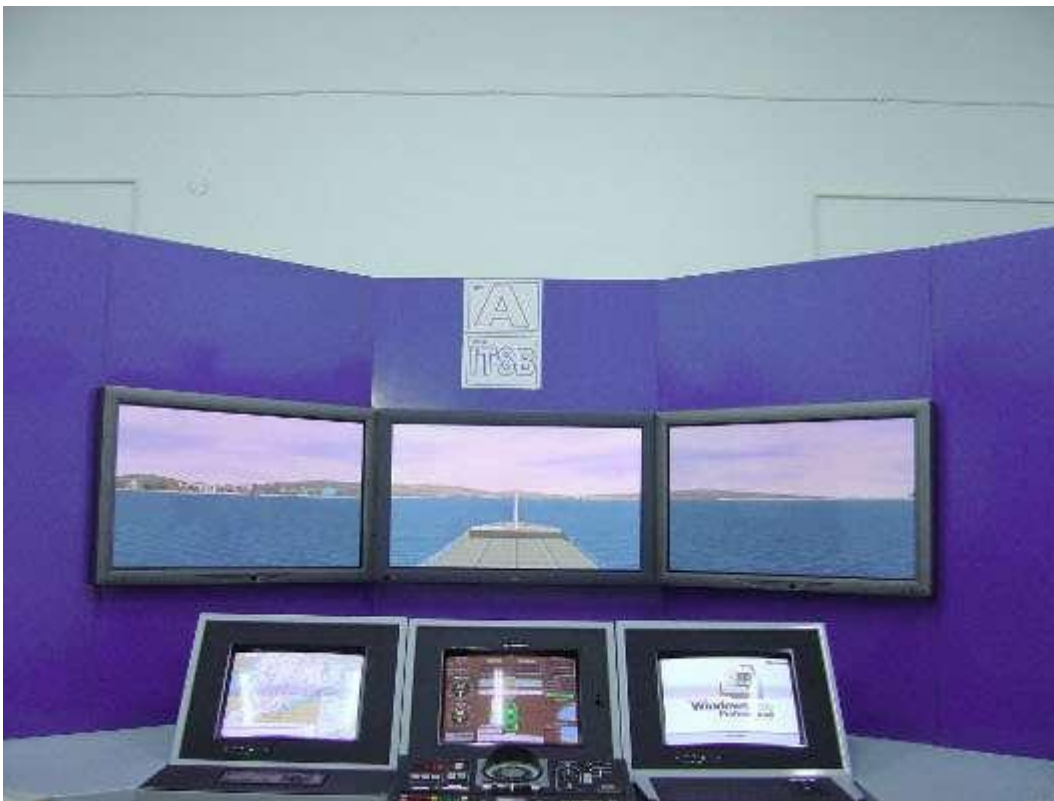
Simulatore di navigazione