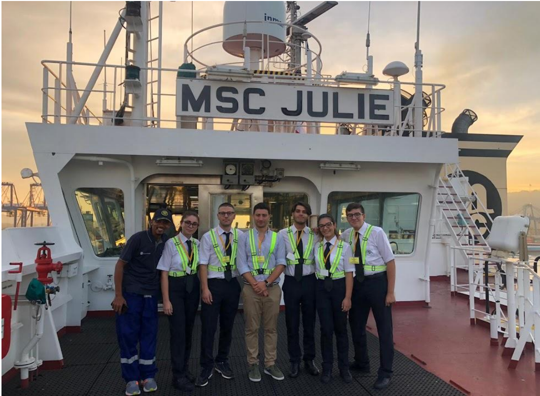
Imbarco sulla Motonave MSC Julie a Panama